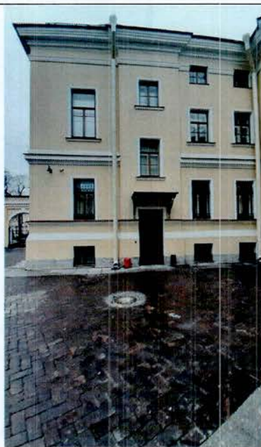
5. Фрагмент дворового фасада