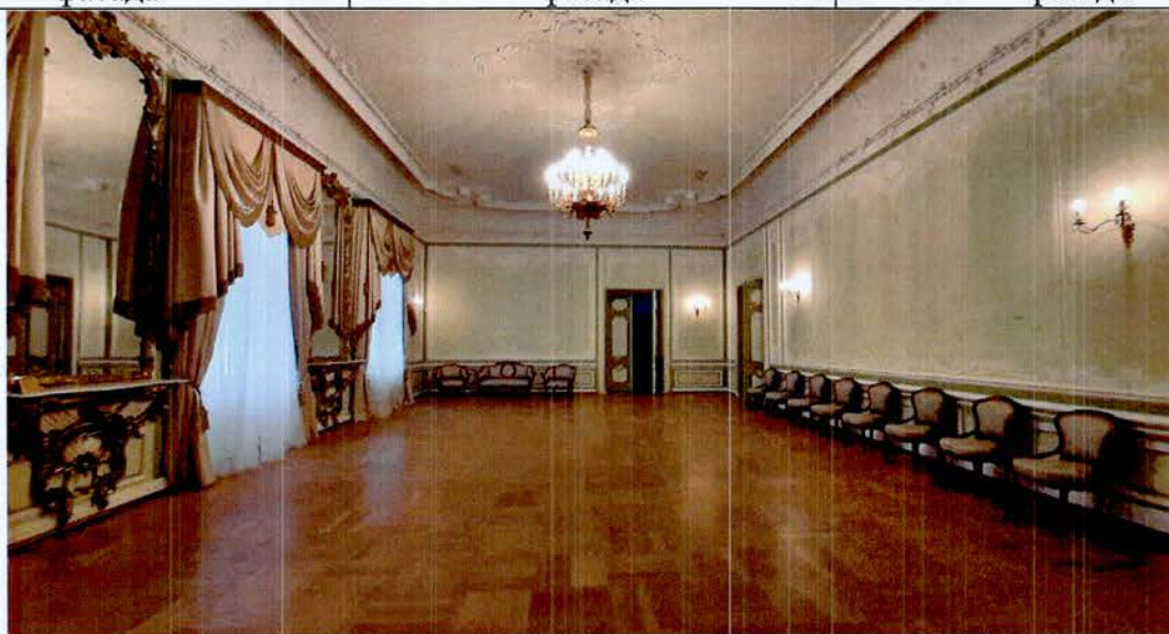
7. Фрагмент интерьера