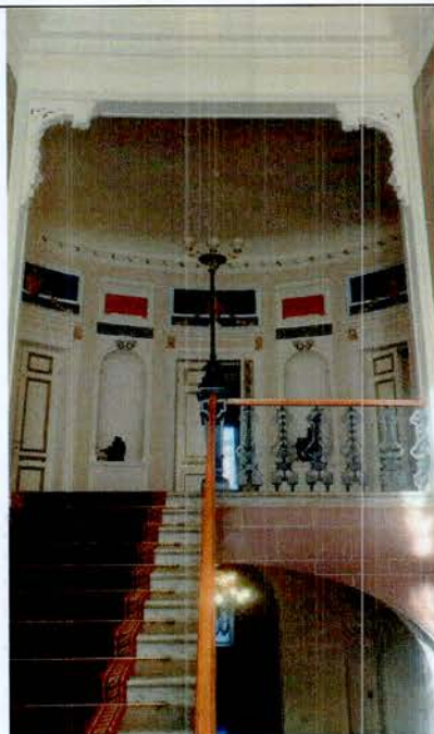
10. Парадная лестница