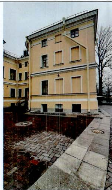
6. Фрагмент дворового фасада