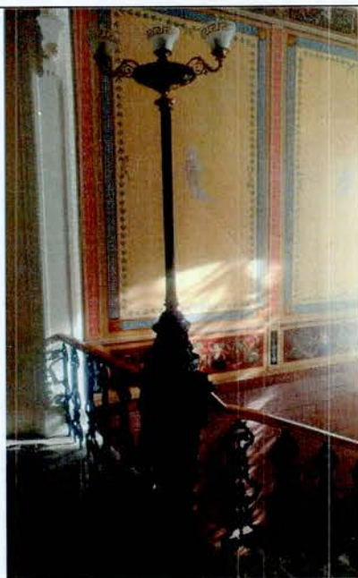
9. Оформление парадной лестницы