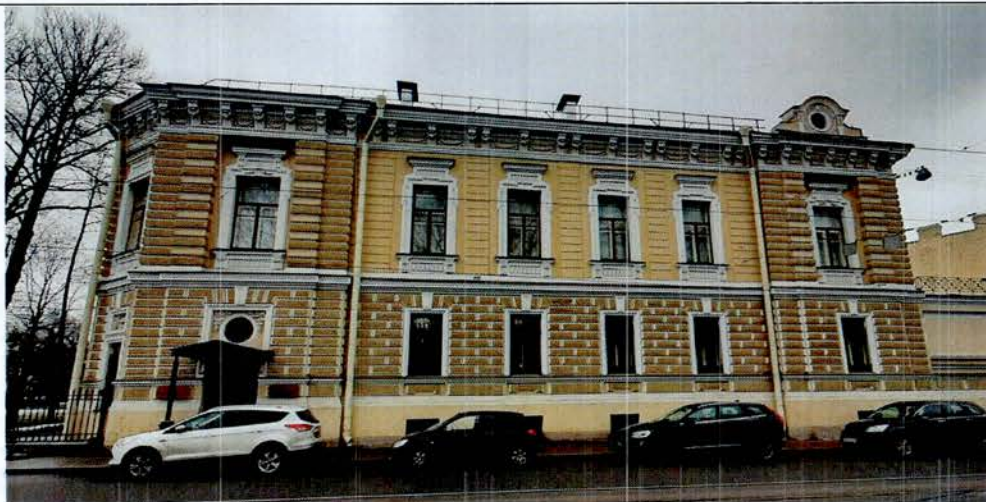
1. Западный фасад

Фотографическое изображение объекта культурного наследия регионального значения «Особняк», расположенного по адресу: Санкт-Петербург, Садовая улица, дом 4, литера А, входящего в состав объекта культурного наследия регионального значения «Усадьба Военного министра», (фотофиксация выполнена 27.01.2021).