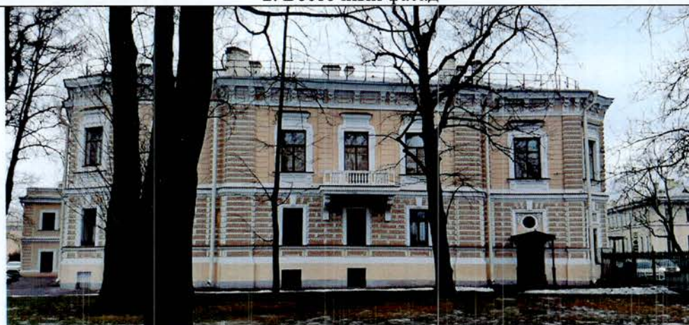
3. Северный фасад