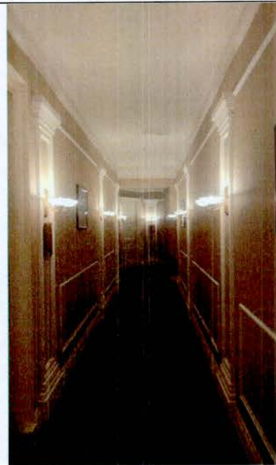
11. Фрагмент интерьера