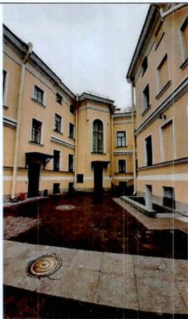
4. Фрагмент дворового фасада