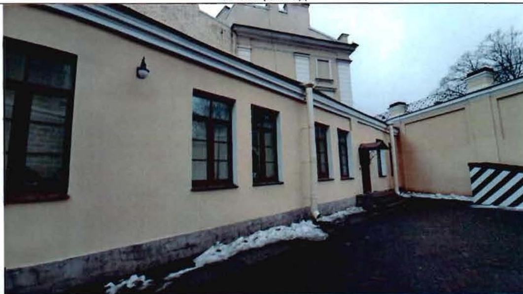
2. Фрагмент северного фасада