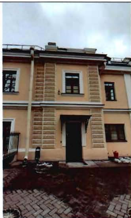
5. Фрагмент северного фасада