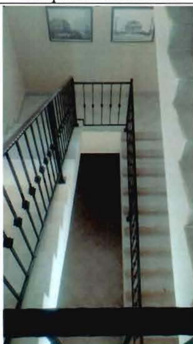
6. Служебная лестница