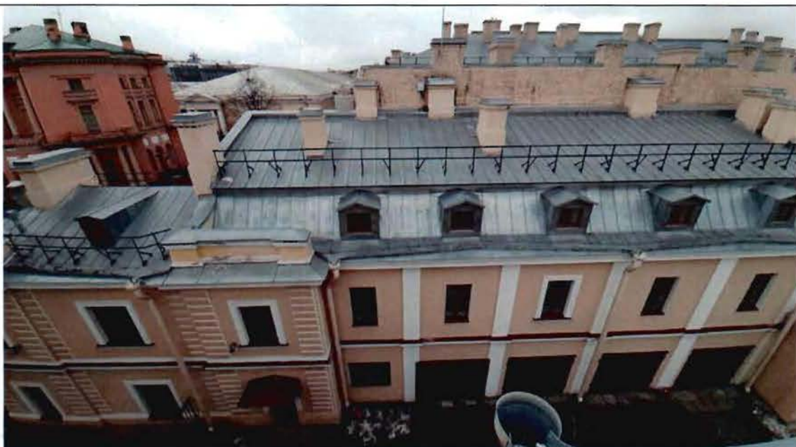
1. Общий вид

Фотографическое изображение объекта культурного наследия регионального значения «Флигель служебный», расположенного по адресу: Санкт-Петербург, Инженерная улица, дом 6а, входящего в состав объекта культурного наследия регионального значения «Усадьба Военного министра», (фотофиксация выполнена 27.01.2021).