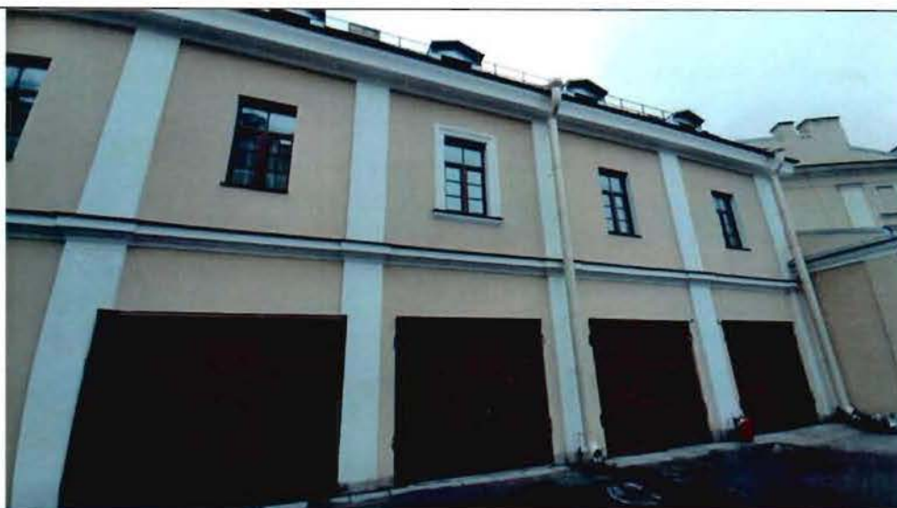
3. Фрагмент северного фасада