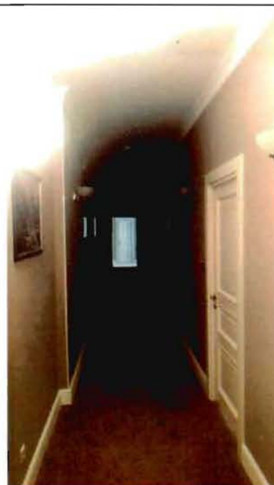
7. Фрагмент интерьера