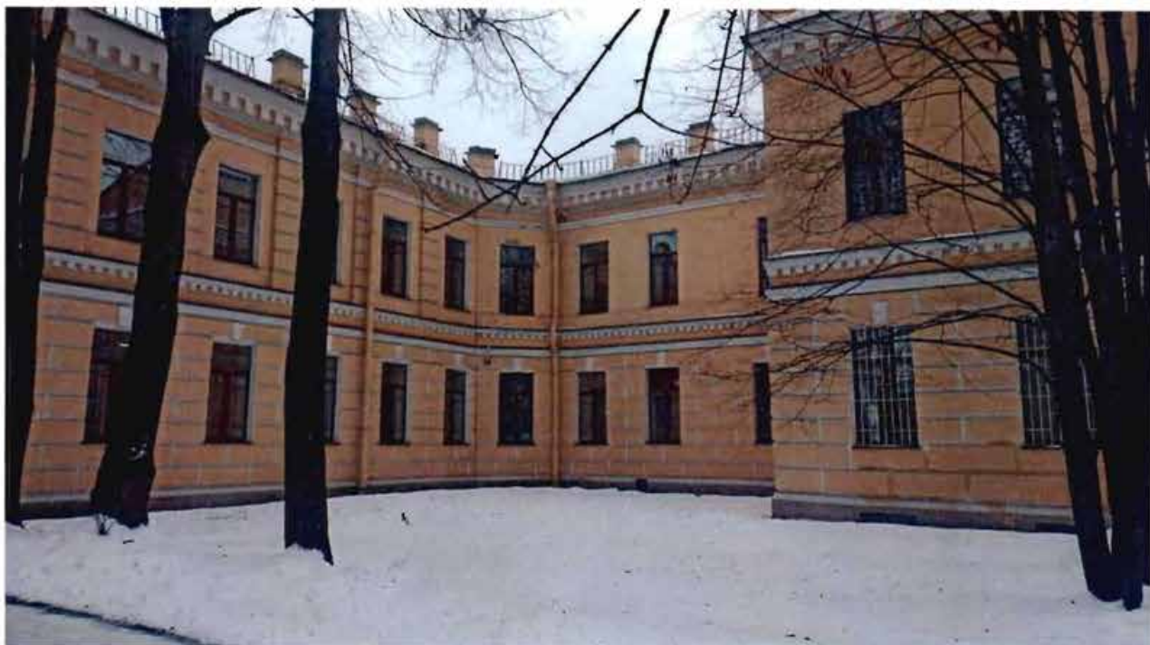
2. Вид на объект культурного наследия с северо-восточной стороны.