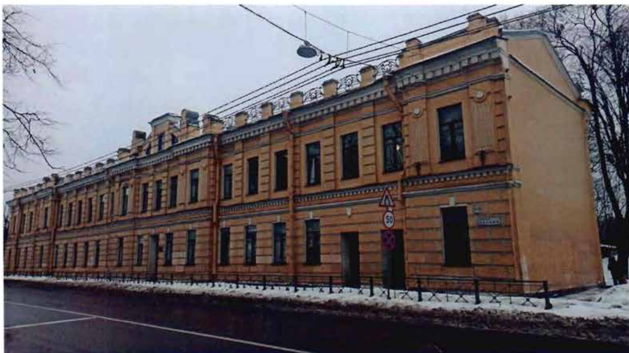
1. Вид на объект культурного наследия с южной стороны.

Фотографическое изображение объекта культурного наследия регионального значения «Главный корпус», расположенного по адресу: Санкт-Петербург, город Колпино, проспект Ленина, дом 1/5, литера А, входящего в состав объекта культурного наследия регионального значения «Больница Ижорских Адмиралтейских заводов» (фотофиксация выполнена 25.02.2021)