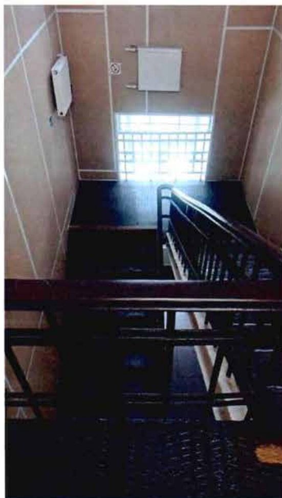
4. Металлическая лестница.