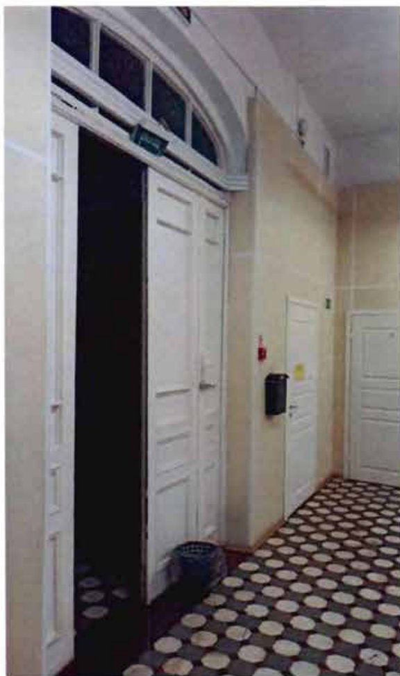
3. Помещение 1-го этажа.