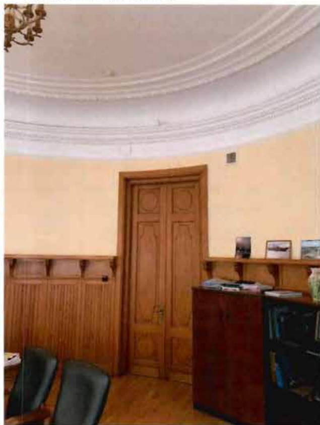
15. Кабинет (пом. 93).