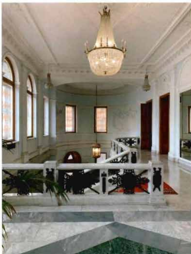
8. Вестибюль парадного входа.