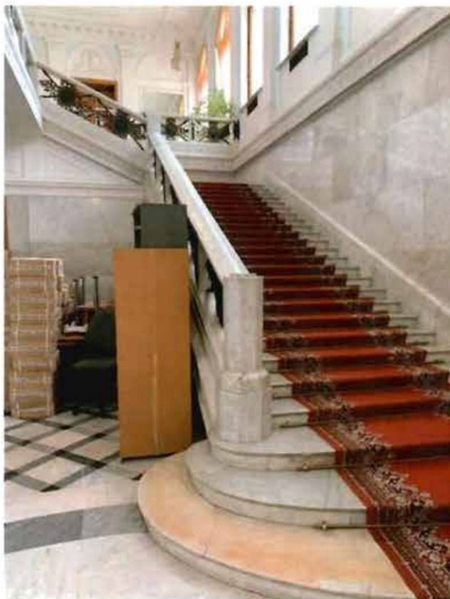
6. Парадная лестница.