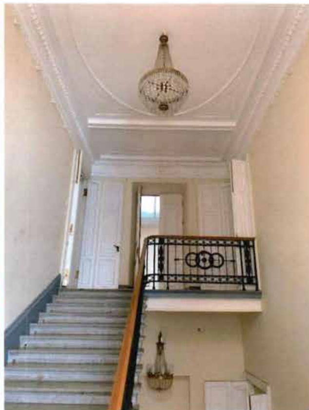
7. Служебная лестница.