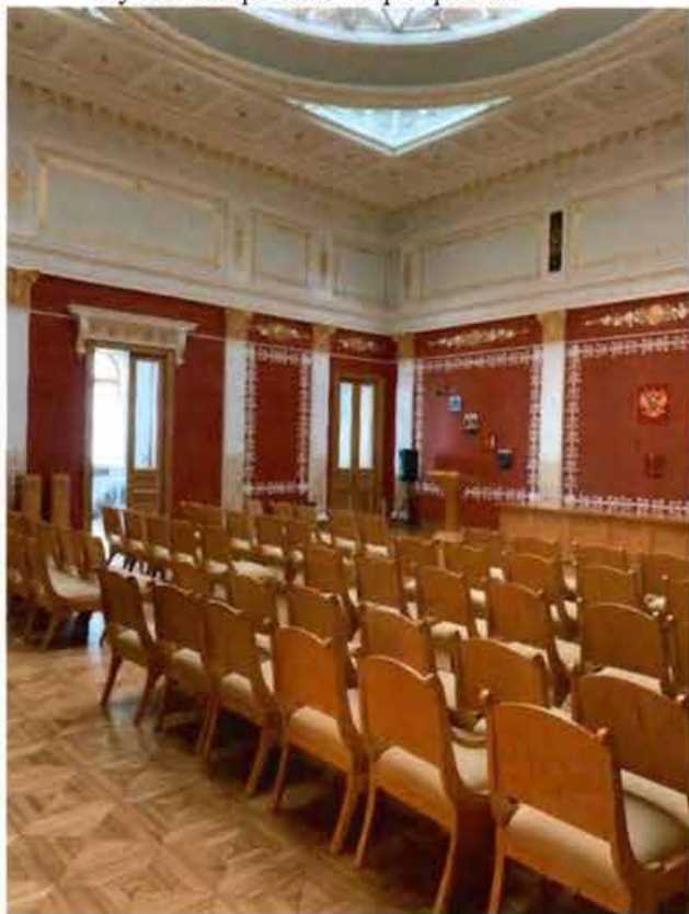
10. Помещение 54. Куполообразное перекрытие.