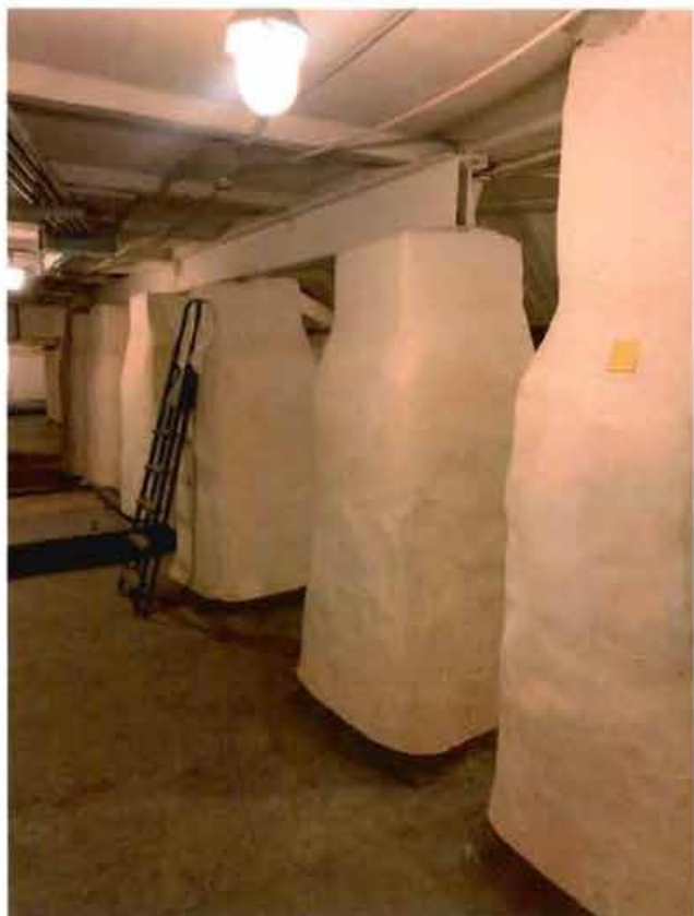
16. Пилоны в подвальных помещениях.