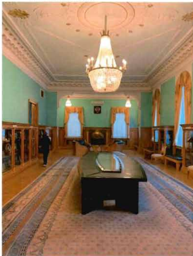
14. Каминный зал.