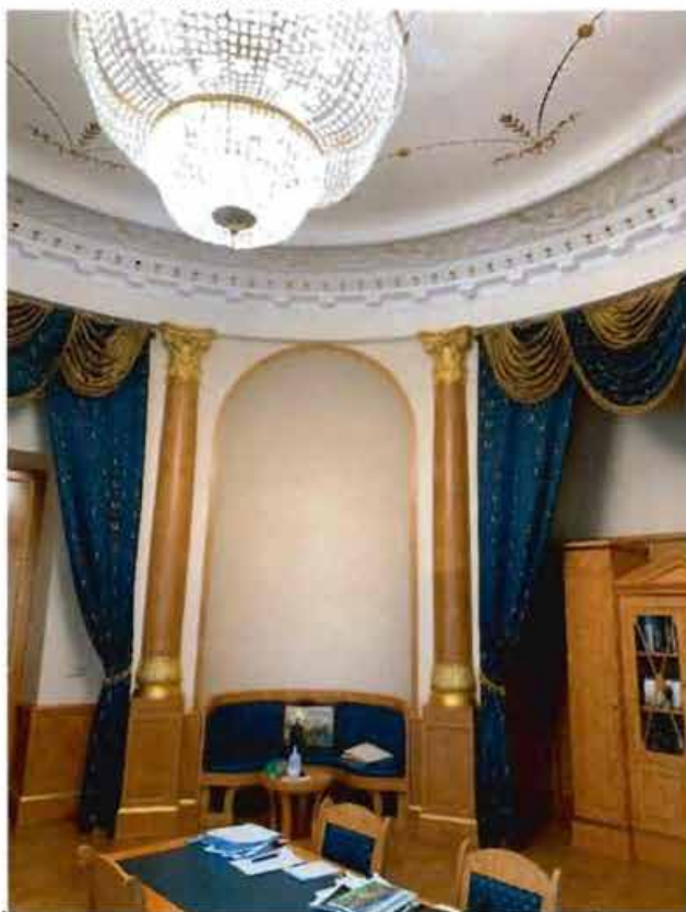
12. Помещение 51.