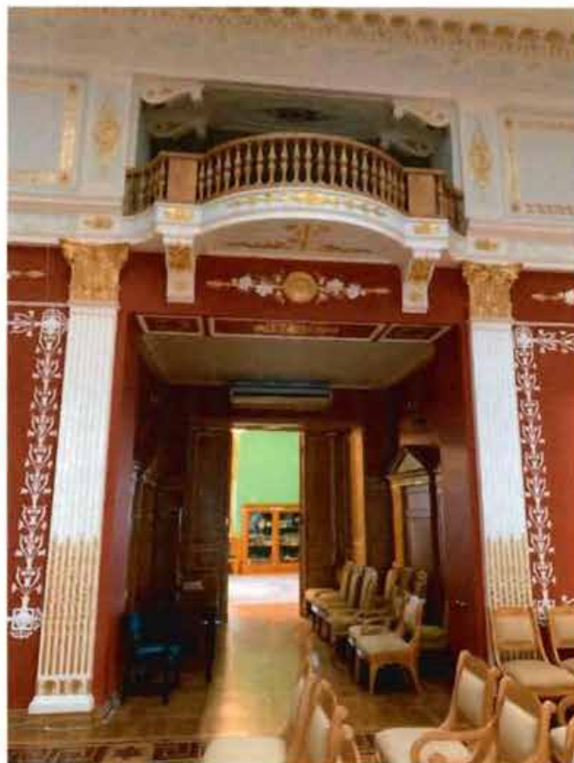
11. Помещение 54 и 47. Балкон на хорах.